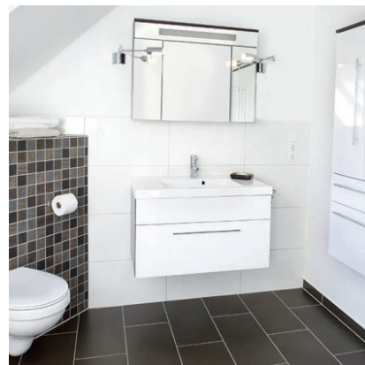
Готовая ванная комната. Швы заделаны затиркой SICHERHEITSFUGE FLEXIBEL.

На стены и на пол. Внутри и снаружи, а также под водой.