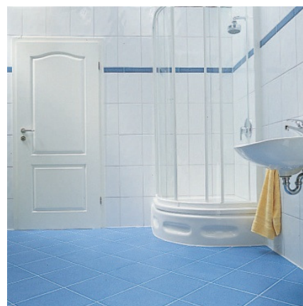
Готовый угол душевой. Угловые и стыковочные швы заделаны герметично.