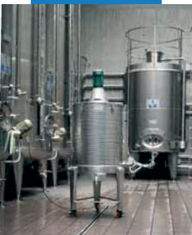
Пример заполнения швов напольном плиточном покрытии на винном производстве