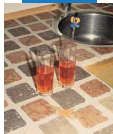
Пример приклеивания и заполнения швов на кухонной столешнице