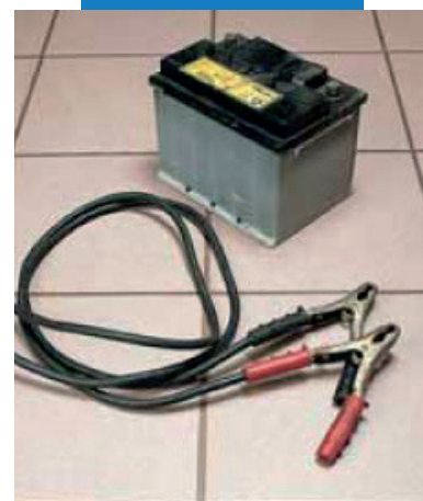
Пример заделки швов в мастерской автотехники

До схватывания Керапоxy (Керапокси) смывается с инструментов и емкостей обильным количеством воды. После схватывания следы Керапоxy (Керапокси) удаляются с помощью Керапоxy Cleaner (Керапокси Клинер) или механически.