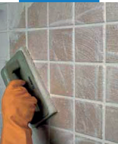
Очистка плитки одинарного обжига абразивным падом