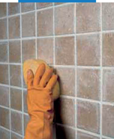
Очистка плитки одинарного обжига с помощью целлюлозной губки

При заполнении швов обеспечиваются следующие характеристики: