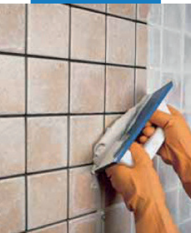
Заполнение швов плитки одинарного обжига на стене резиновым шпателем