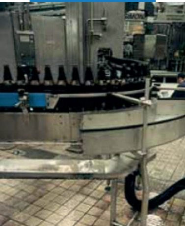
Пример заполнения швов в напольном плиточном покрытии на пивном заводе

Вся необходимая справочная информация по материалу доступна по запросу, а также на сайте https://aomapei.ru .