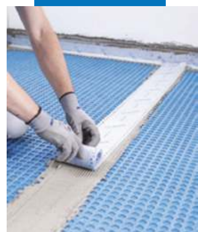
Гидроизоляция швов между листами с помощью Mapeband Easy на Mapeguard WP Adhesive