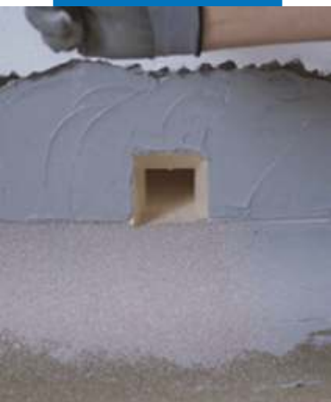
Гидроизоляция дренажных отверстий Drain Front