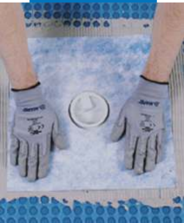
Гидроизоляция дренажных отверстий Drain Vertical/Drain Lateral