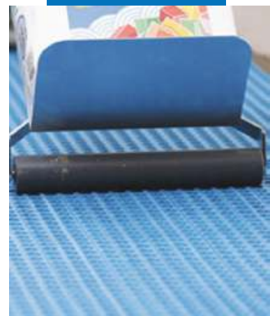
Прикатывание Mapeguard UM 35