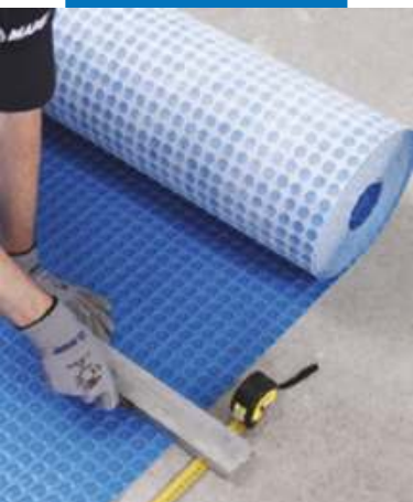
Резка Mapeguard UM 35