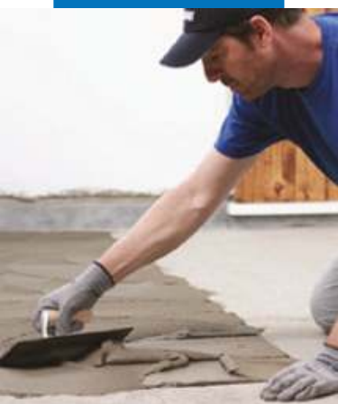
Нанесение клея зубча- тым шпателем №5