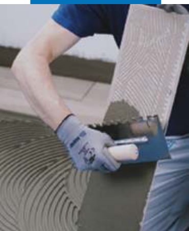
Укладка керамической плитки или камня на подходящий клей MAPEI класса не ниже C2