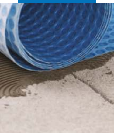
Укладка Mapeguard UM 35 Укладка Mapeguard UM 35