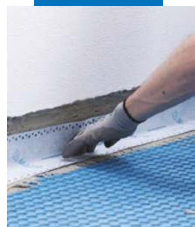
Гидроизоляция по краям с помощью Mapeband Easy на Mapeguard WP Adhesive