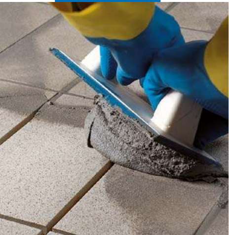
Нанесение Керапоху CQ резиновым шпателем MAPEI