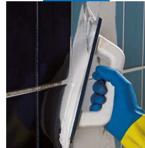
Нанесение Керапоху CQ на стены резиновым шпателем MAPEI

Плитка и отделочные материалы следует очистить после заполнения швов пока Керапоху CQ остаётся свежим, во всех случаях в пределах 60 минут после нанесения, даже если поверхность кажется чистой