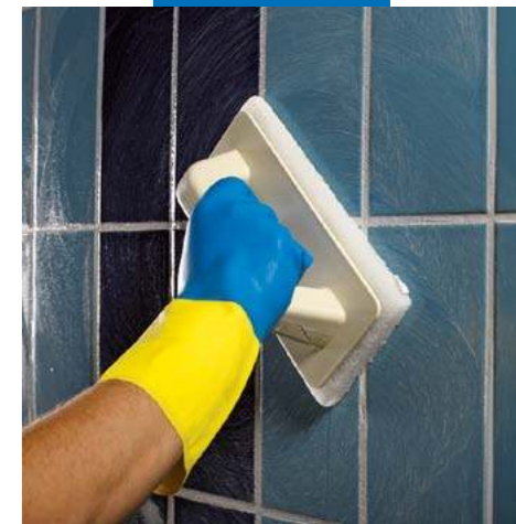
Удаление с поверхности излишки Керапоху CQ падом "Scotch-Brite®" с водой