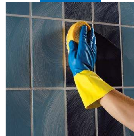
Окончательная очистка твердой целлюлозной губкой