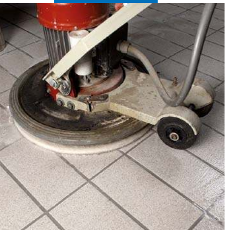
Очистка поверхности водой и дисковой машиной с абразивным падом, таким как "Scotch-Brite®"