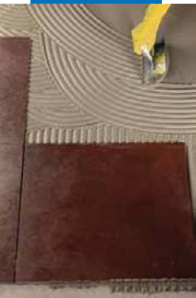
Укладка керамической плитки на стену