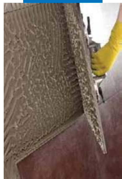
Необходимо смачивать 100% обратной стороны плитки при укладке крупноформатного гранита