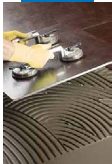
Укладка крупноформатного керамогранита на Kerabond T-R замешанный с Isolastic

Прим.: технические данные клея Kerabond T-R , затворенного на латексной добавке Isolastic , приведены в технической спецификации Isolastic .