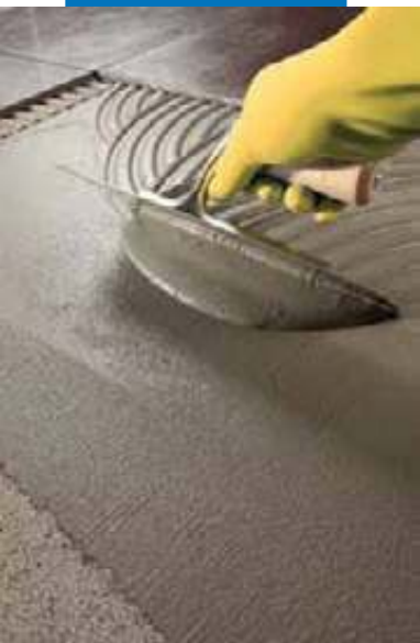
Укладка плитки на Kerabond T-R на пол