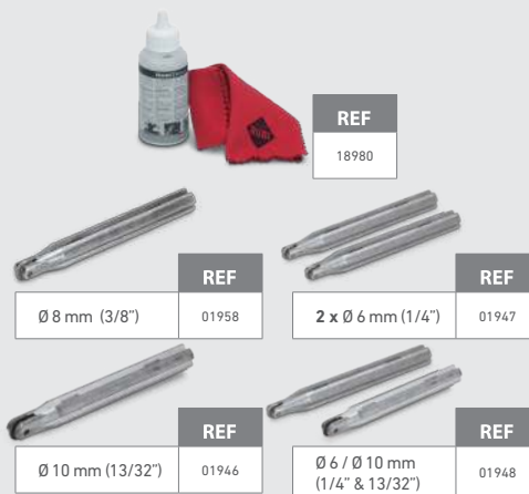
REF 18980 Ø 8 mm (3/8") REF 01958 2 x Ø 6 mm (1/4") REF 01947 Ø 10 mm (13/32") REF 01946 Ø 6 / Ø 10 mm (1/4" & 13/32") REF 01948