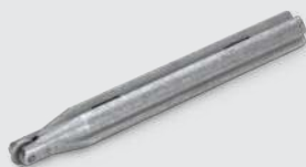
Ø 6 mm (1/4") REF 01945