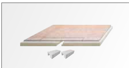
Schlüter®-KERDI-SHOWER / -SHOWER-L модульные системы для изготовления душевых поддонов на уровне пола с керамической плиткой. Имеются наклонные планки - по выбору с компенсационными планками - различных размеров для централизованного дренажа Schlüter-KERDI-DRAIN или для линейного дренажа Schlüter-KERDI-LINE, сочетающиеся с системой.