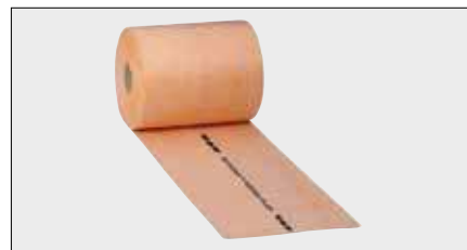
Schlüter®-KERDI-FLEX Гибкое изоляционное полотно для герметизации деформационных швов