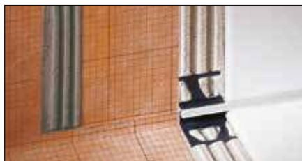
Schlüter®-KERDI-200 / -KERDI-DS Для герметизации стен и полов в сочетании с плиточным покрытием