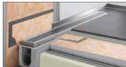
Schlüter®-KERDI-LINE Комплексный набор для линейного слива в душевых поддонах на уровне пола