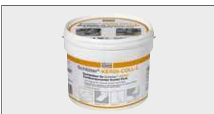
Schlüter®-KERDI-COLL-L представляет собой двухкомпонентный уплотняющий клей на основе акриловой дисперсии без растворителя и цементирующего реактивного порошка. Он пригоден для склеивания и уплотнения уложенных внахлестку полотен и стыковых соединений лент Schlüter-KERDI .