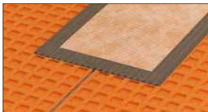
Schlüter®-KERDI-KEBA Для герметизации стыков и соединений стена-пол