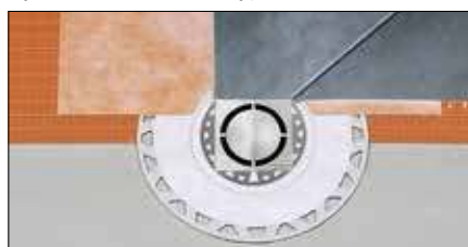
Schlüter®-KERDI-DRAIN Система напольного слива для надежного подключения комбинированной изоляции, созданной с помощью Schlüter-KERDI , или других герметизирующих систем к канализации