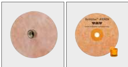
Schlüter®-KERDI-KM / -MV Манжеты для проводки труб