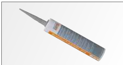
Schlüter®-KERDI-FIX пригоден для склеивания и герметизации окантовки и стыков полотна Schlüter-KERDI