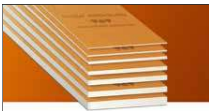
Schlüter®-KERDI-BOARD универсально используемая основа для укладки плитки в зоне стены всех видов, также непосредственно как комбинированная изоляция. Schlüter-KERDI-BOARD пригоден для использования в качестве основы для шпаклевочного и штукатурного раствора.