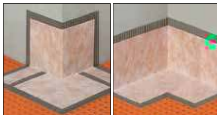
Schlüter®-KERDI-KERECK Готовые внешние и внутренние уголки